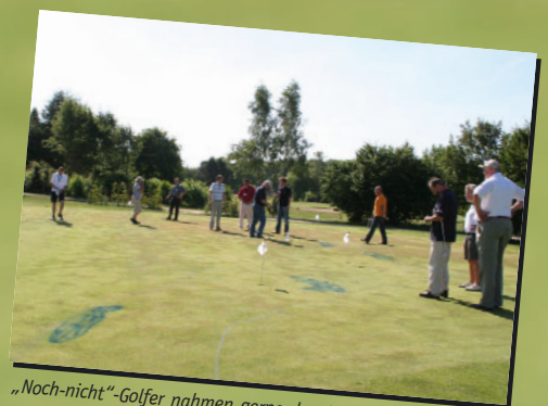
„Noch-nicht“-Golfer nahmen gerne das Angebot zum „Schnupergolfen“ an.