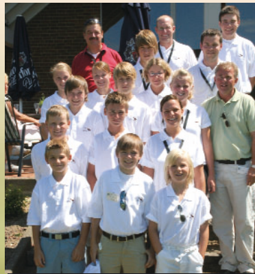
Talentierte Golfnachwuchs begleitet fachmännisch die Gäste über die 18-Loch Anlage. Ein kleiner Beweis für die vorbildliche und profihafte Organisation durch den Golfclub.